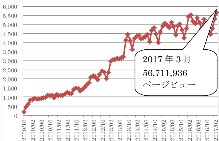
(万ページビュー) 月間ページビュー(開設当初～)